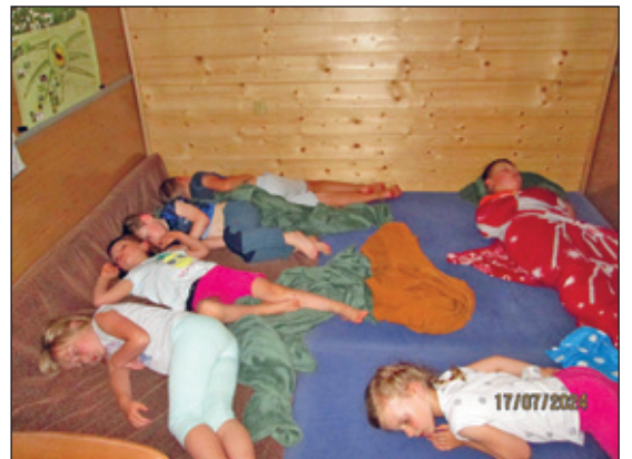
Mittagsruhe im Waldwagen

Die Hortkinder der Kita Sonnenschein und Grashüpfer hatten sich wieder zusammengetan, um gemeinsam wieder viel zu erleben. Nach der Wanderung nach Blockhausen standen unter anderem noch einige Besuche des Neuhausener Freibades, ein Besuch im Museum der Agrargenossenschaft, eine Wanderung zur Kreuztanne, eine Wasserschlacht, der Feuerwehrbesuch und viel Zeit zum Basteln, Kochen und Backen auf dem Programm. In der letzten Ferienwoche war das Waldmobil der Stiftung „Schutzgemeinschaft Deutscher Wald“ zu Besuch. Es hatte Tierskelette und -felle mit, damit die Kinder sich diese mal genauer anschauen konnten. Im