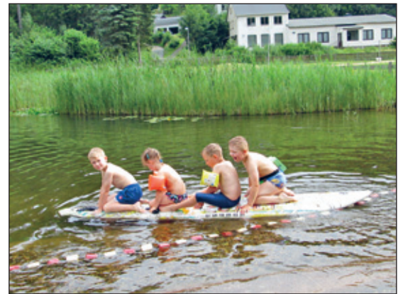
Baden im Ökobad