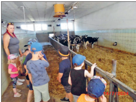
Im Stall der AG Bergland