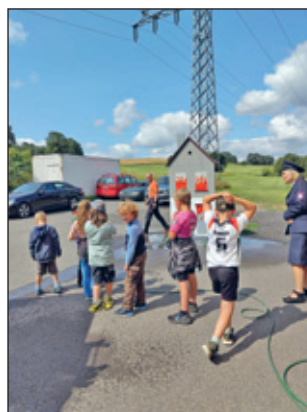
Zielspritzen bei der FFW