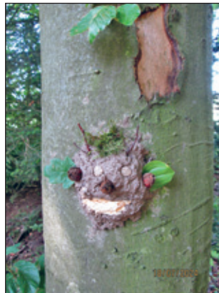
Waldgeister wurden gestaltet