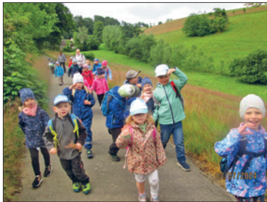
Wanderung übers Waldeck zum Schweizerhof