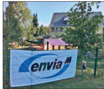
Auch von der Straße ist es gut zu sehen.