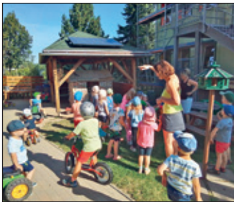
Einweihung des Balkonkraftwerkes

Wir bedanken uns ganz herzlich bei enviaM für die Finanzierung sowie bei der Firma Dach-Drechsler und Elektro-Uhlich für die unkomplizierte Installation auf unserem Gartenhausdach!